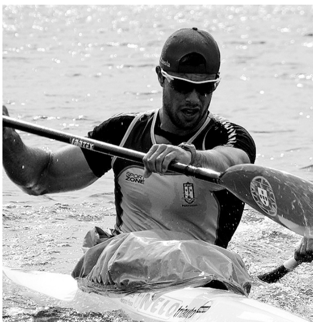
Canoagem quer marcar a diferença a partir de Montemor-o-Velho

Em causa está a partilha de meios materiais e humanos,